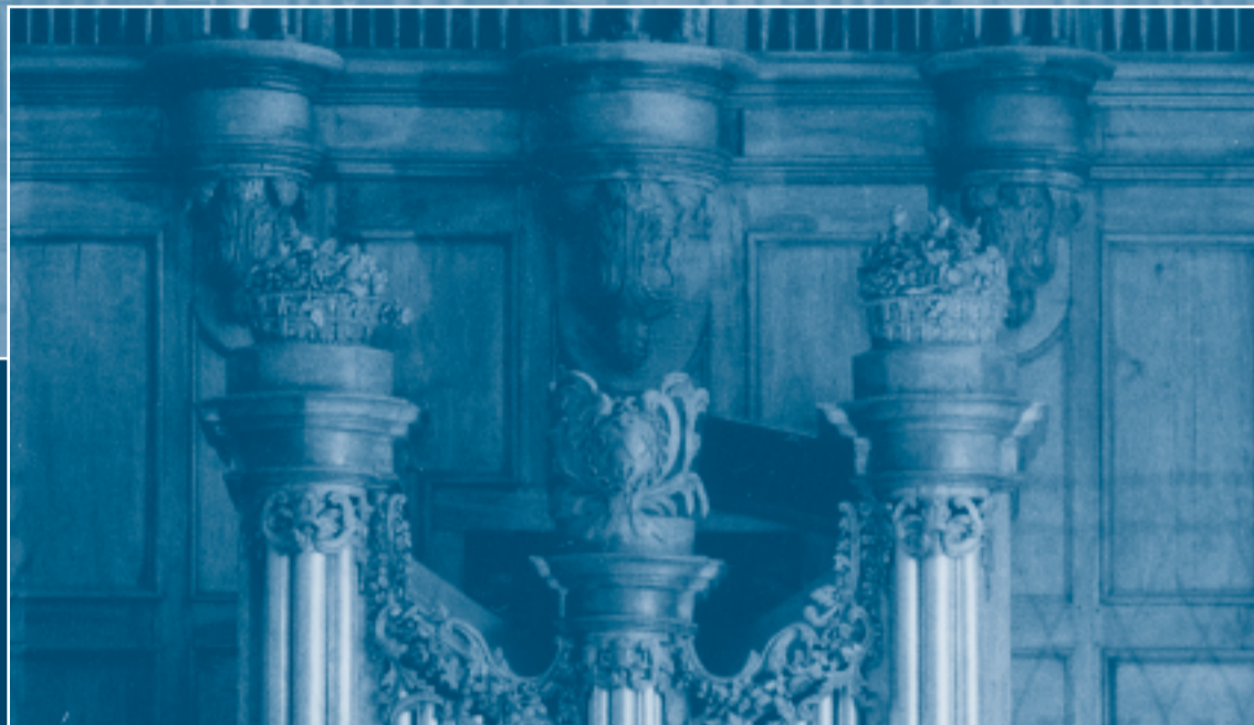
Abbaye de Gellone, orgues historiques du XVIII e siècle